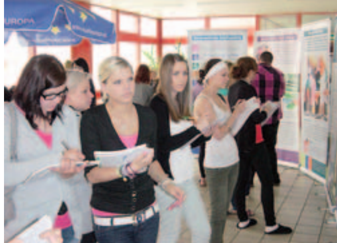
Reges Interesse herrschte bei der Europaratsausstellung in der Berufsschule Ried i. L., die im Unterricht im Rahmen der politischen Bildung eingesetzt wurde.

Die BürgerInnen sind durch die heutige Informationsschwemme überfordert und verunsichert. Zu viele, teils widersprüchliche Informationen, prasseln auf sie ein. Europa befindet sich zweifelsohne in der größten Krise seit dem Zweiten Weltkrieg. Eins muss jedoch klar sein: Es handelt sich um eine Finanz- und keine Eurokrise. Dank der EU und der Währungsunion sind wir noch mal mit einem blauen Auge davongekommen. Die von den USA ausgehende Finanzkrise führte