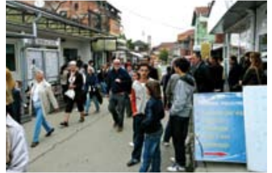
Im Botschaftsviertel von Prishtinë.

vielen Menschen, die uns vor Ort unterstützt und so diesen Ablauf ermöglicht haben.