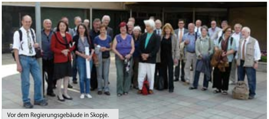
Vor dem Regierungsgebäude in Skopje.

Kosovo zu seinem Nachbarn Serbien, von dem sich das Land erst 2008 unabhängig erklärt hat, wurde berichtet. Dass dieses Programm so stattfinden konnte, verdanken wir