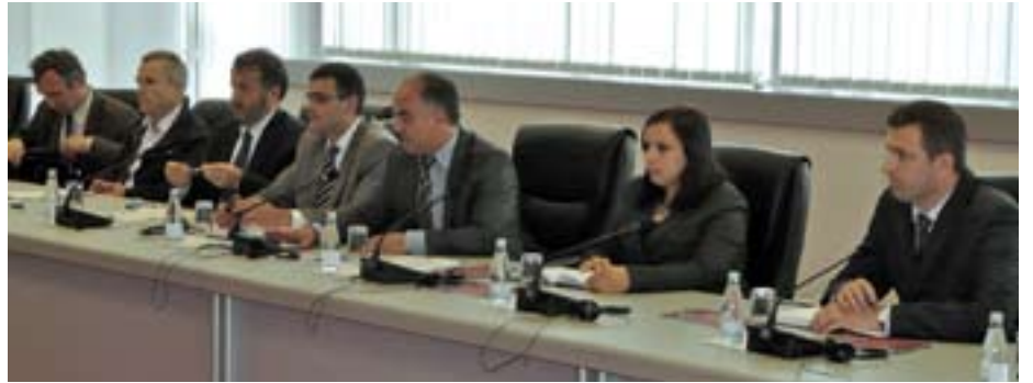
Staatssekretär Fitim Gllareva und sein Team erläutern die Lage der Republik Kosovo.

Wir haben Mazedonien und einen kleinen Teil des Kosovos aber auch touristisch „erfahren“, römische Ausgrabungsstätten, Moscheen, orthodoxe Kirchen und Klöster, unberührte Natur, eindrucksvolle Gebirge, tiefe Schluchten, große Seen, blühende Wiesen, interessante Städte und idyllische Dörfer vorgefunden, die darauf warten, auch von Ihnen entdeckt zu werden. (FT)