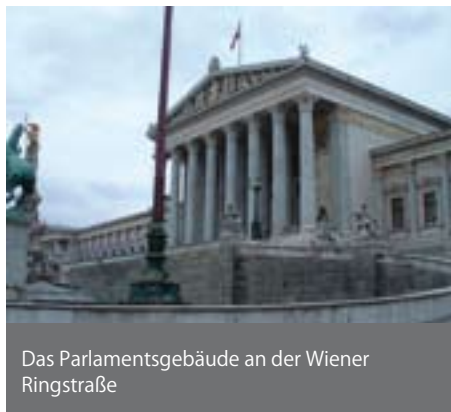
Das Parlamentsgebäude an der Wiener Ringstraße

Wer hat politische Macht in Österreich, wer in Europa? Welche Institutionen spielen welche Rolle? Wozu brauchen wir in EU-Eu-