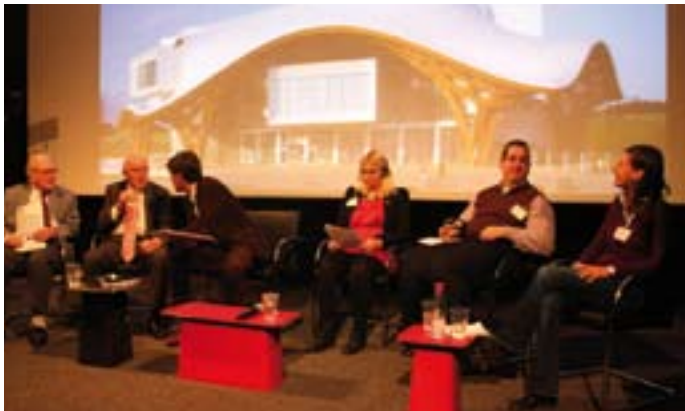
Die Diskussionsrunde zur Zukunft unseres Kontinents.

Vertreterinnen und Vertreter von 48 Mitgliedseinrichtungen aus zehn Nationen des European Network for Education and Training (EUNET), darunter das Institut für Europa im Salzburger Bildungswerk, trafen sich im französischen Metz zu Jahreskonferenz und Mitgliederversammlung, die auch der Fortbildung und dem Dialog dienten. Besondere „Highlights“ waren die Kür des