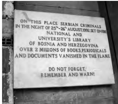
An der ausgebrannten Nationalbibliothek in Sarajevo.