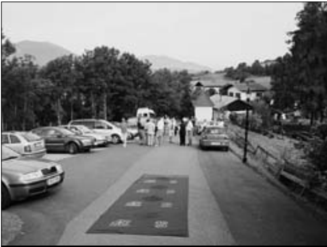
Die Demonstranten kamen mit einem Teppich vors Schloss.

im europäischen Rahmen gelöst werden. Gleichzeitig müssten die vereinbarten Ziele von den Regionen – und vielfach auch von den Kommunen – im EU-Rahmen mitgetragen und umgesetzt werden. Dies werde beispielsweise beim Umweltschutz deutlich.