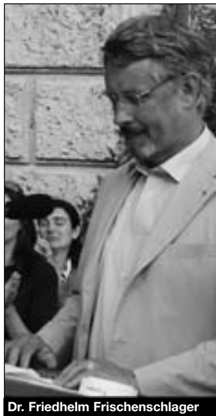
Dr. Friedhelm Frischenschlager

Über 100 TeilnehmerInnen aus acht europäischen Staaten diskutierten Mitte Juli 2008 drei Tage im Europahaus Neumarkt über die EU-Regionalpolitik und auch über die aktuelle politische Situation nach dem gescheiterten Referendum in Irland zum Vertrag von Lissabon.