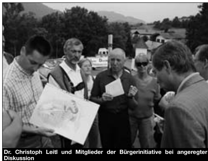
Dr. Christoph Leitl und Mitglieder der Bürgerinitiative bei angeregter Diskussion

Zwischen den Mitgliedern der Bürgerinitiative und WKÖ-Präsident Dr. Christoph Leitl kam es dann zu einer emotional geladenen Aussprache.